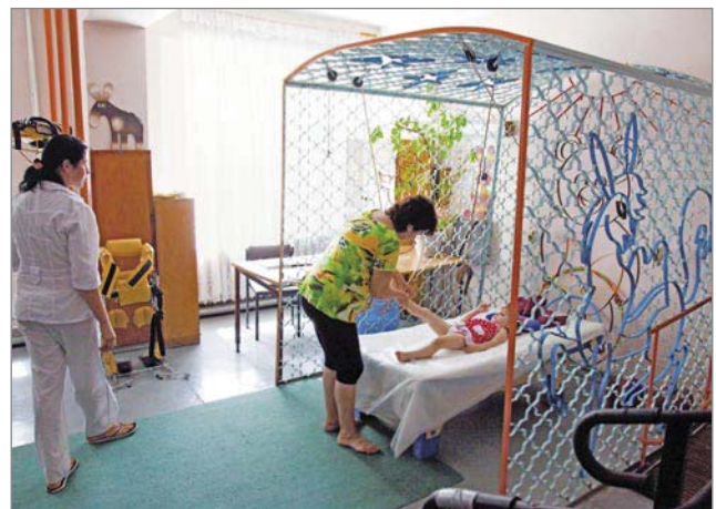
Одне з лікувальних приміщень санаторію «Хаджибей»