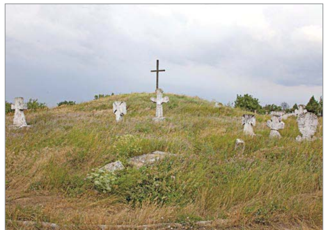
Козацькі могили на кладовищі Усатового нагадують про засновників села