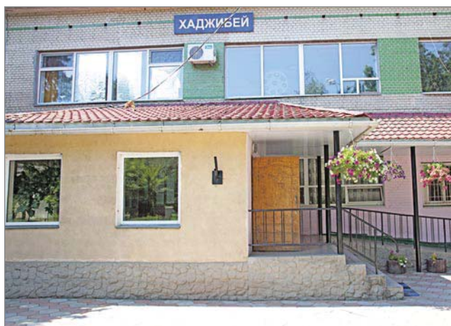
Адміністративна будівля санаторію «Хаджибей»

Паралельно з лиманним відділенням міської лікарні в селі Усатове працювали пункти