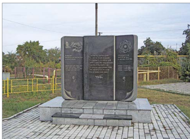
Пам'ятник воїнам-інтернаціоналістам та ліквідаторам аварії на Чорнобильській АЕС