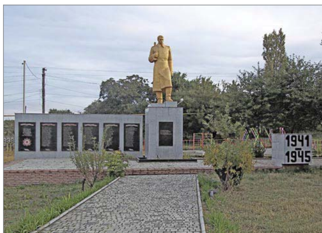
Пам'ятник радянським воїнам, загиблим у роки Великої Вітчизняної війни