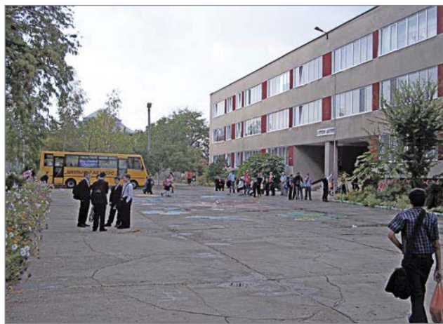
Усатівська НВК «Школа-гімназія» імені Петра Даниловича Вернидуба