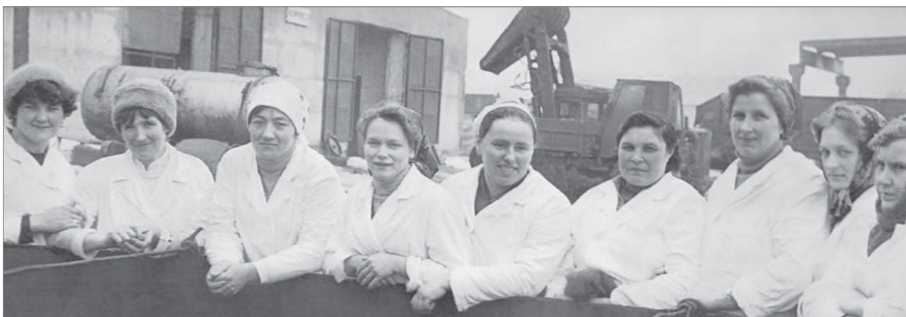
Працівниці змішаної тваринницької ферми радгоспу імені Кірова протягом восьмої, дев'ятої та десятої п'ятирічок щороку перевиконували план