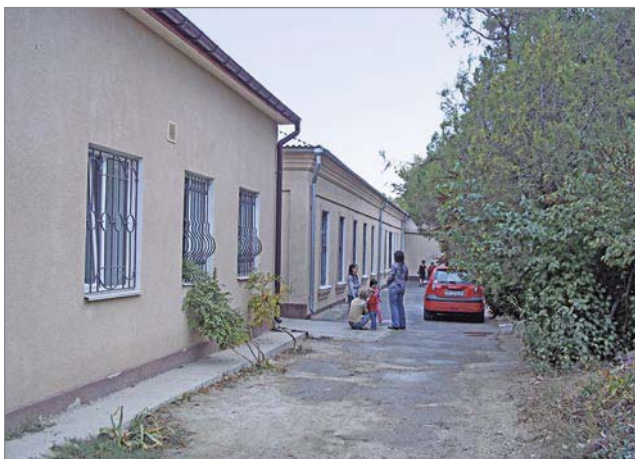
Усатівська амбулаторія загальної практики сімейної медицини