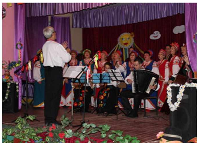
Народна хорова капела «Світоч» Роздільнянського палацу культури

...Люди добрі, киньте горе – Такшепоче Чорне море. Променій південна зоре, Ти, Одещино, моя. В нас народів не злічити Звикли ми у дружбі жити, Один одного любити, бо у всіх душа одна.