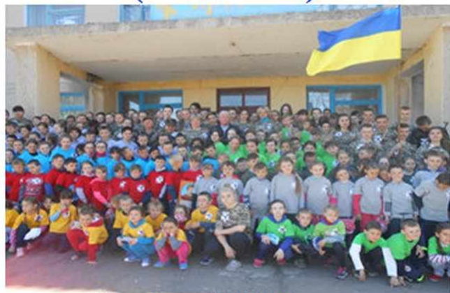
Виноградарська ЗОШ I-III ступенів